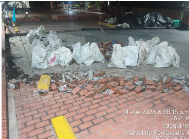
Remoción de mortero de pendiente