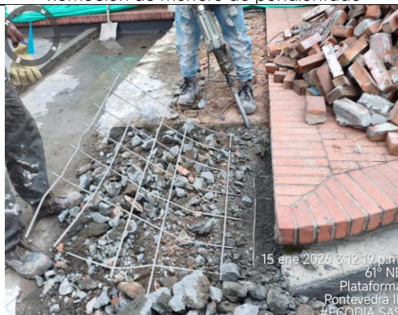
Retiro de sistema de impermeabilización existente